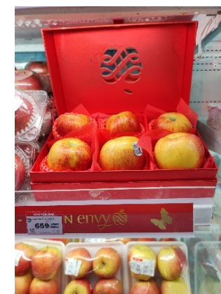
エンヴィの ギフトボックス