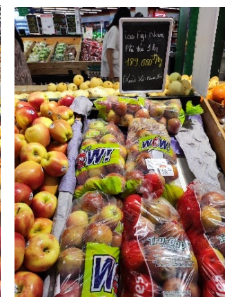
JULIET、南アフリカ産ふじ