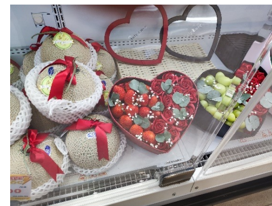
バレンタインギフト (いちご、メロン、ぶどう)