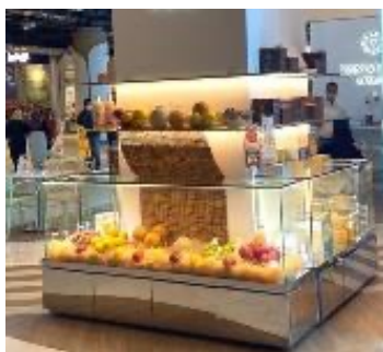
海外（ドバイ）における日本産果物の展示