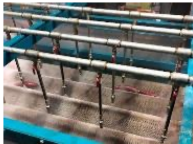
かんしょの洗浄機械 洗浄ブラシの素材の違いで、かんしょの傷のつき具合を検証