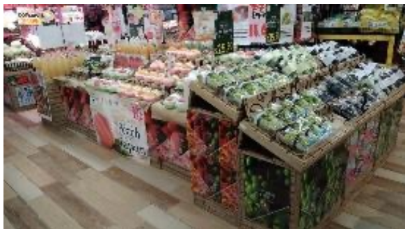
海外小売店における販売の様子