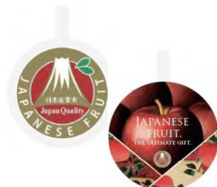
日本産果実マークによるPR