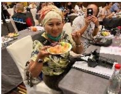
シンガポール、タイ、マレーシアで旬の日本産果物をメディア向けに紹介