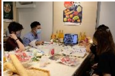
令和4年は国内7か所、海外（6か国）で商談会を開催