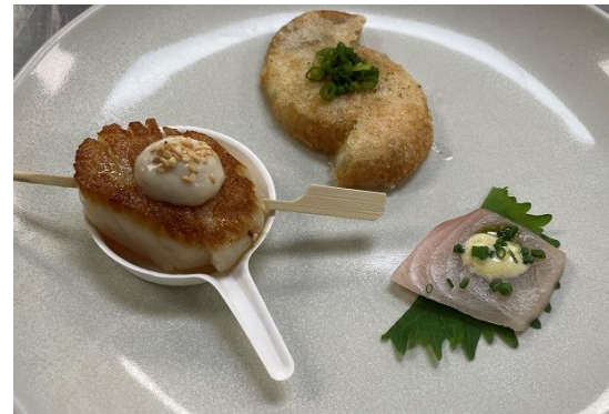
岸田総理試食メニュー 3品