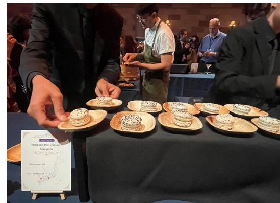
ゆずと黒ゴマのマカロン