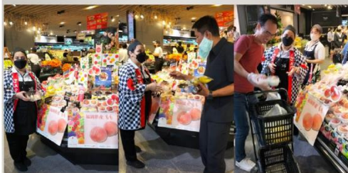
TOPS FOODHALL CHIDLOM