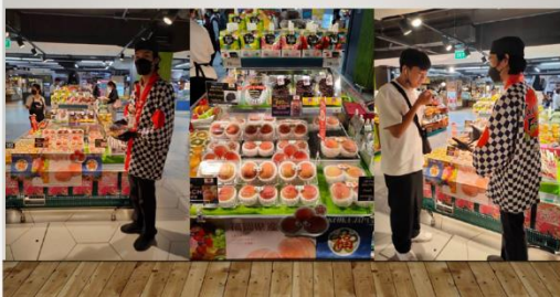
TOPS FOODHALL LADPRAO