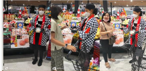
TOPS FOODHALL BANGNA