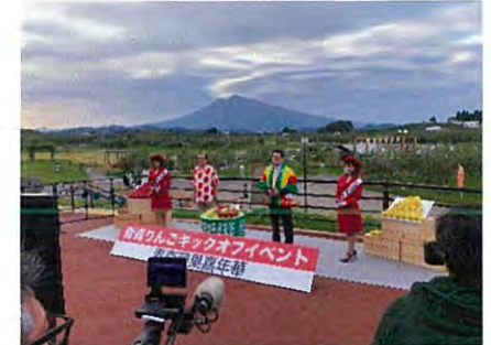
自然豊かな産地の風景と りんご園地を映像で体感