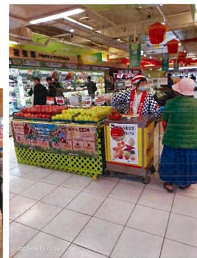
忠孝店での試食会