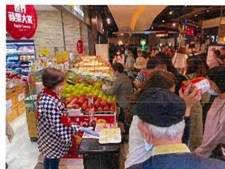
マネキン、統一資材を活用した試食会 (台湾内69店/営業日)