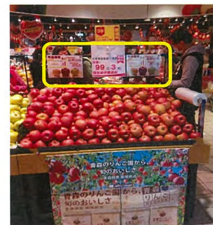
大潤發南湖店での試食会 健康機能性について記載したPOP活用