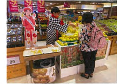
日本産果物統一資材を活用してPR