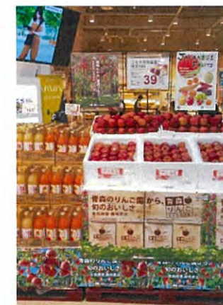
日本産果物統一資材を活用してPR