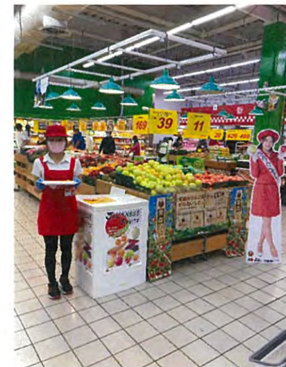
大潤發員林店での試食会