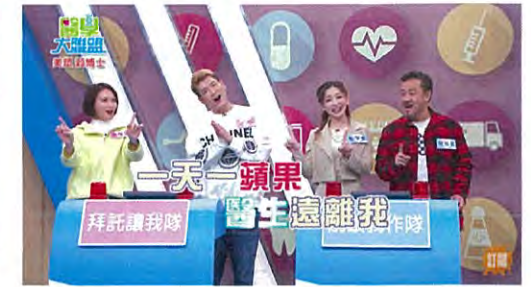
「1日1個のりんごは医者知らず」