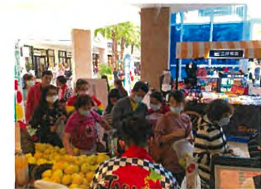
売場には多数の人だかり