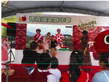
ステージイベントの様子