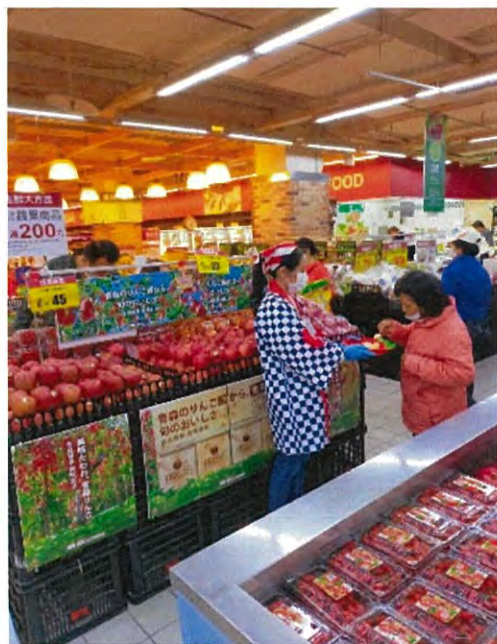
年内販売で主にばら売りを中心とした展開