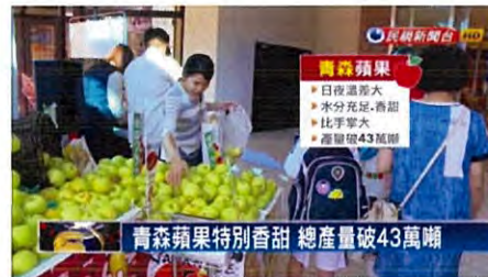
テレビニュース取材及び放映