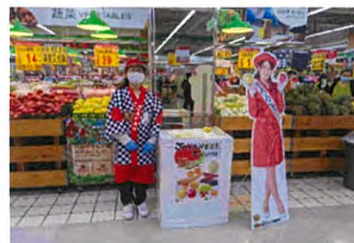
大潤發八徳店での試食会