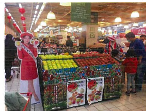
南雅店での試食会