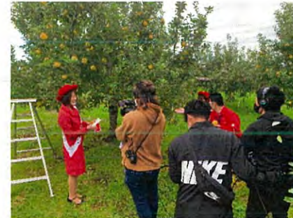
りんご園地からの中継 リモートでの収穫体験