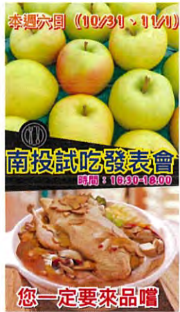
10月20日 日本産りんご販促PRイベント (試食会、箱購入がお得になる抽選券配布で大盛況)