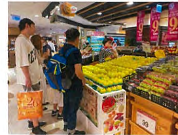
販促イベントの様子(大葉店)