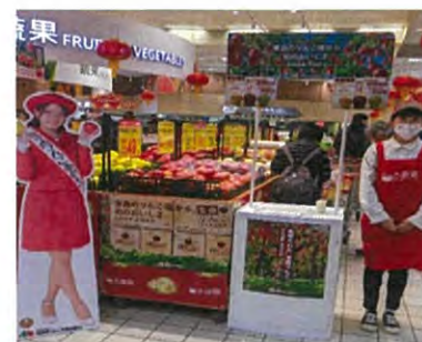
大潤發忠孝店での試食会