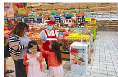
大潤發嘉義店での試食会