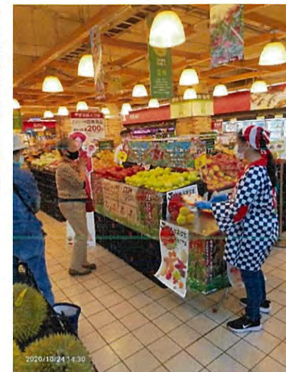
景美店での試食会