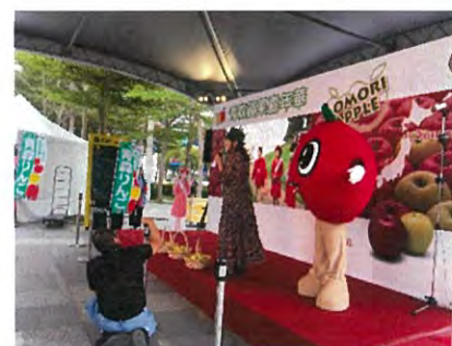
ステージの様子 りんご園地のライブ中継