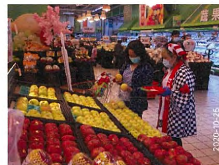
桃園店での試食会