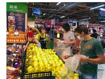
10月試食宣伝会の様子 日本産りんごトキの売り込み