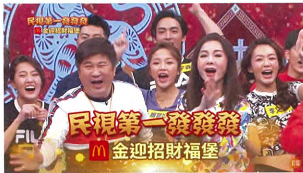
明星運動聯合年報嘉賓 | 民視第一發發發-牛轉乾坤福龍門-2021除夕特別節目