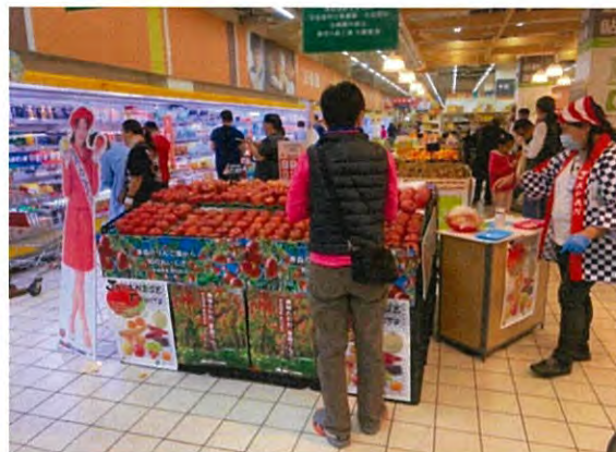
日本産果物統一資材を活用して試食会を実施