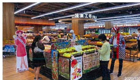
水湳店での試食会