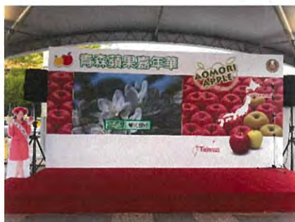
台湾会場 産地と繋がる大型モニター設置