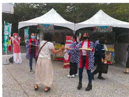
イベントに合わせた試食宣伝会による集客呼び込み