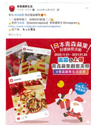
当選した投稿の一例