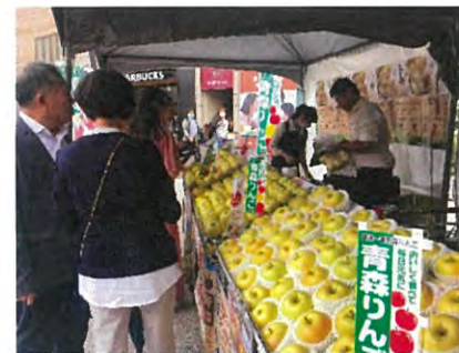
ステージ脇には日本産りんご特設販売コーナーを設置