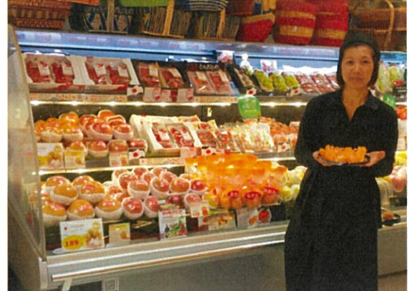
エムクォーティエ