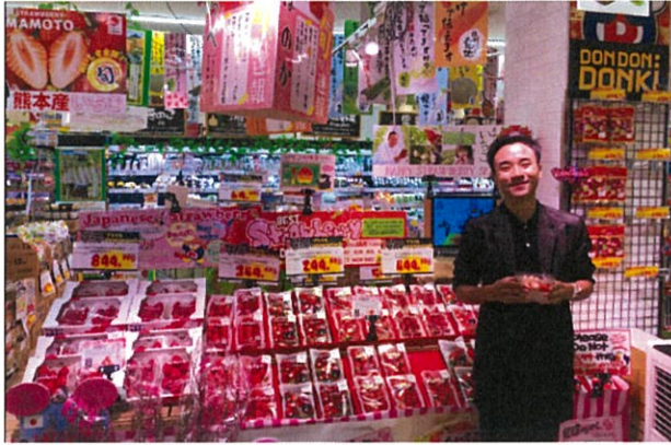
ドンキモール トンロー