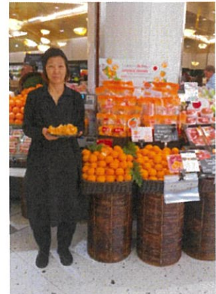
サイアムパラゴン