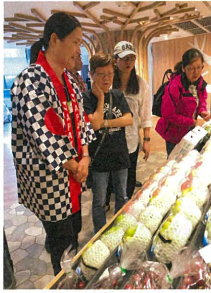
来店者に商品特徴を説明。