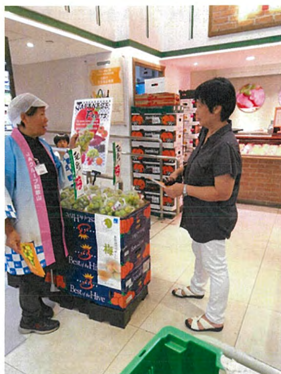
対面販売で説明を促す。