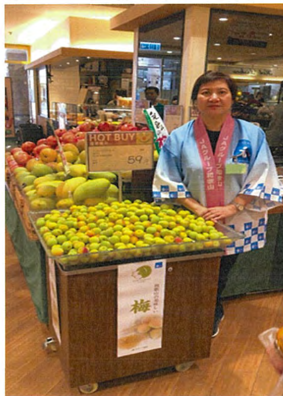
バラ商品も展開し、 ボリュームを主張