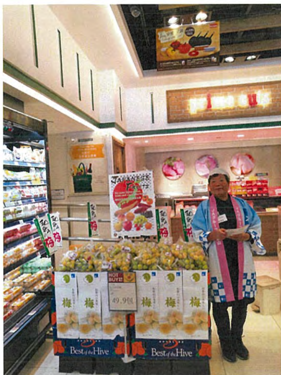
Market Place Tin Hau店の様子