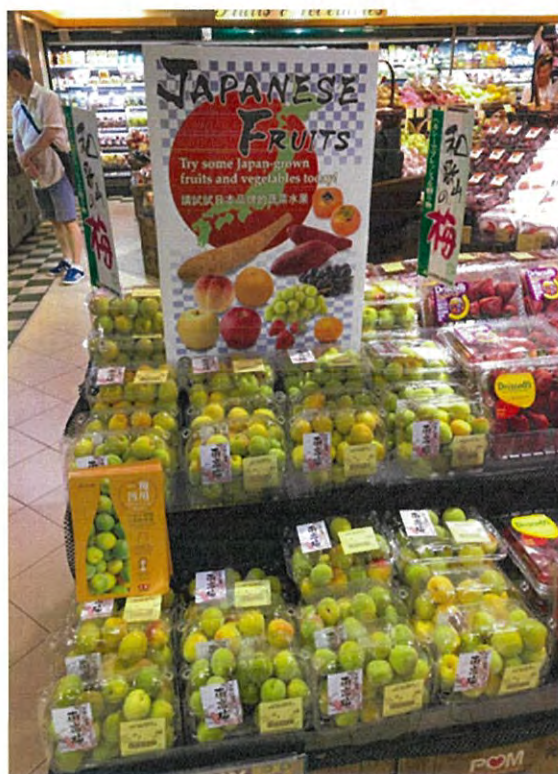
Mong Kok店ででの販促 日本産果物ポスターでPR