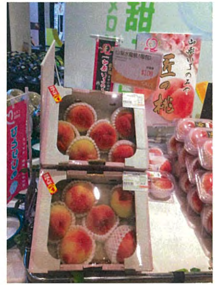
この規格がよく売れる。