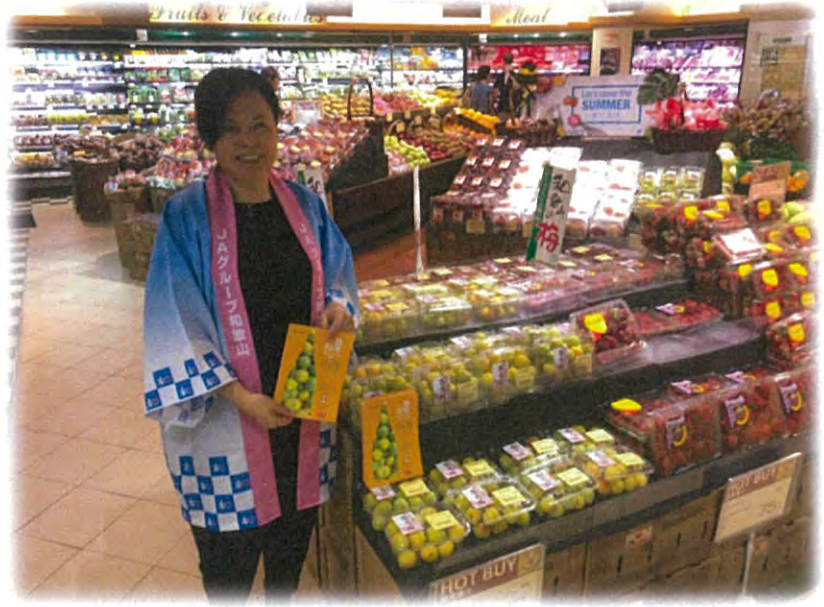
「香港 小売店舗 JA全農フェア」