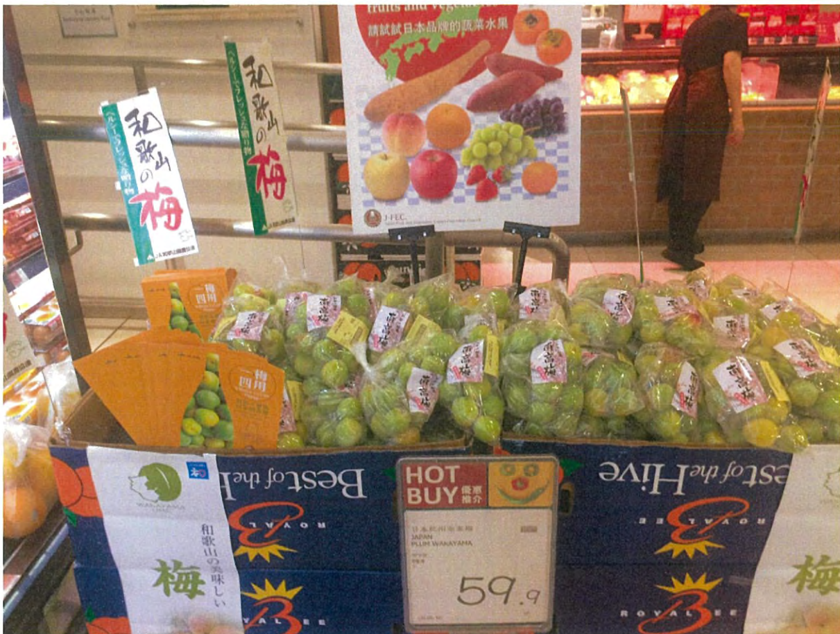
現地の陳列の様子