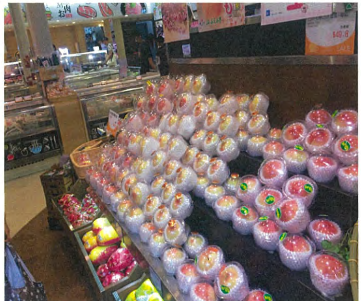
「香港 小売店舗 JA全農フェア」