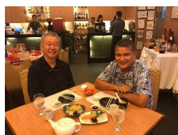
きんぶらレストラン 営業販促打合せ