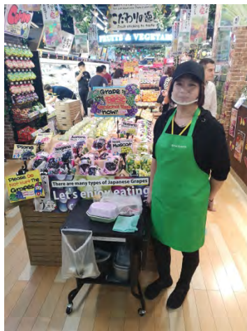
Clark Quay Central 店