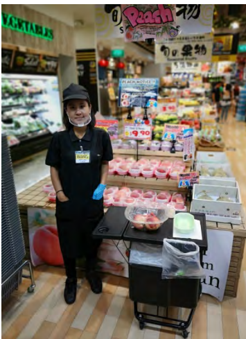
Novena Square2 店