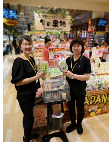
City Square Mall 店