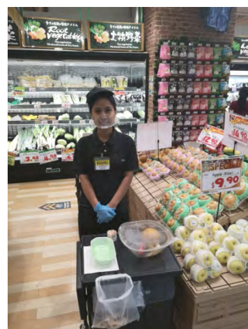
Jcube Mall 店