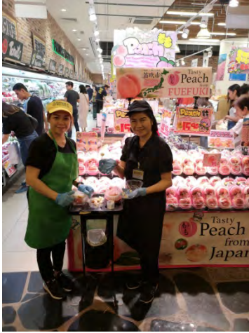
Orchard Central 店