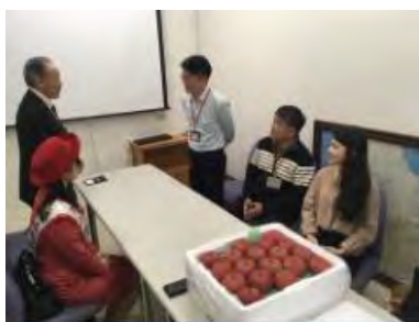
Wellcome, Jasons 本社訪問商談、後港店試食 PR