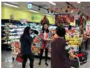
PX マート内湖徳安店