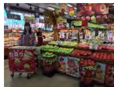
PX マート新莊幸福店