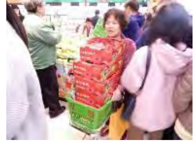
試食宣伝会（贈答需要箱入りの売行き大）