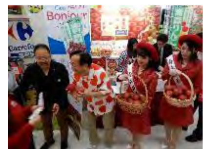
販促宣伝会での PR（ジャパンフルーツ統一イメージを活用）