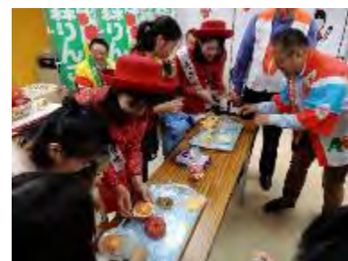
児童施設等での試食宣伝会