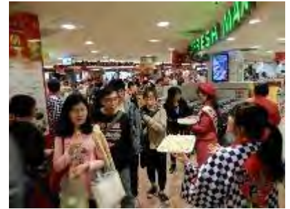
SOGO 百貨店果物売場での試食宣伝会（日本産果物の PR）