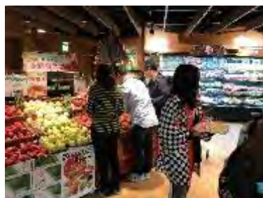
PX マート天母中山北店