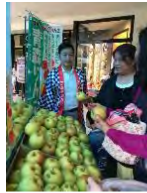
三井アウトレットモール林口店での試食宣伝会、PR イベント（ジャパンフルーツ統一資材の活用）