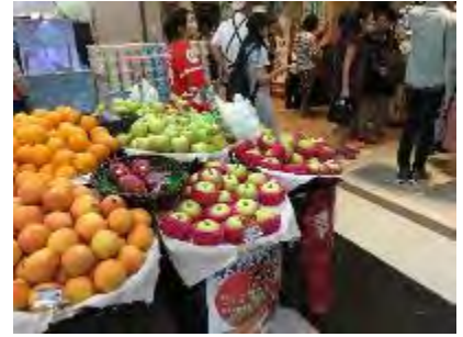
漢神百貨店 JASONS での試食宣伝会（統一資材の活用）