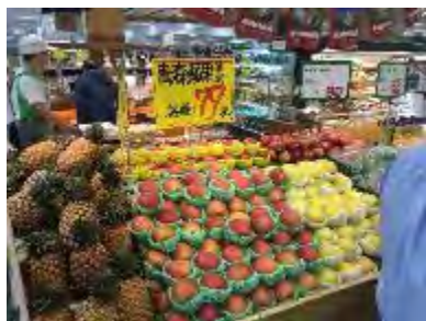
楓康超市中科店 販売促進