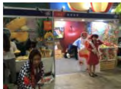
全聯実業商品展示会 試食 PR