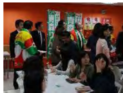
企業内試食会等でも配布