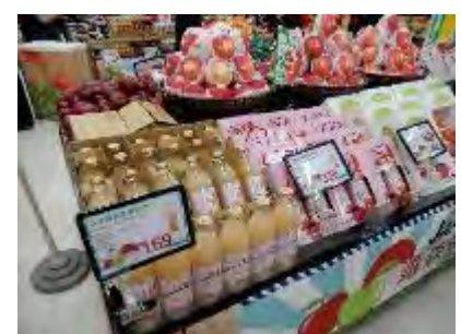
試食宣伝会、会場展示 PR ブース（ジャパンフルーツ統一資材活用）