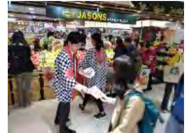
JASONS 売場 試食宣伝会（統一資材活用）