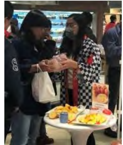
微風超市でのプロモーション（ジャパンフルーツ統一資材の活用）