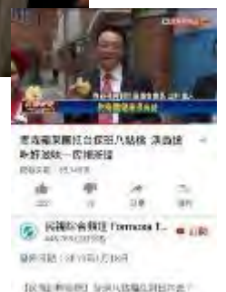
民視テレビでの試食 PR