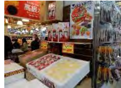
贈答需要のアイスボックスの売行き好調