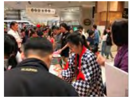
漢来百貨店でのプロモーション（ジャパンフルーツ統一資材の活用）