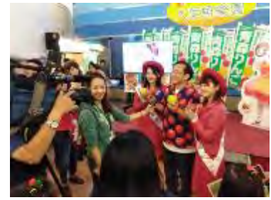
現地メディア取材の様子