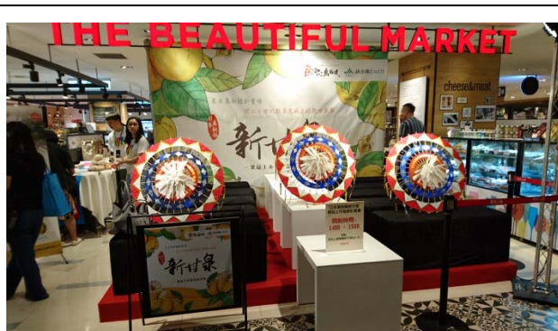
メディアプロモーション会場

台湾向けの早生梨（二十世紀・新甘泉）輸出にあわせ、台湾販売各店舗にて試食宣伝を行うとともに、新甘泉の PR 強化に向けて販売促進団を派遣、メディアプロモーションを含めた宣伝活動を実施した。