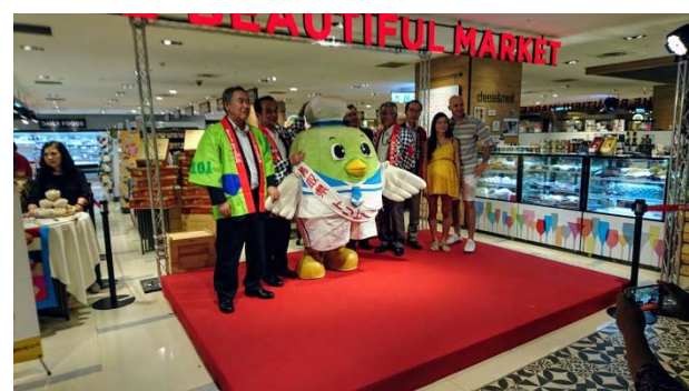
関係者と鳥取県マスコットによる PR