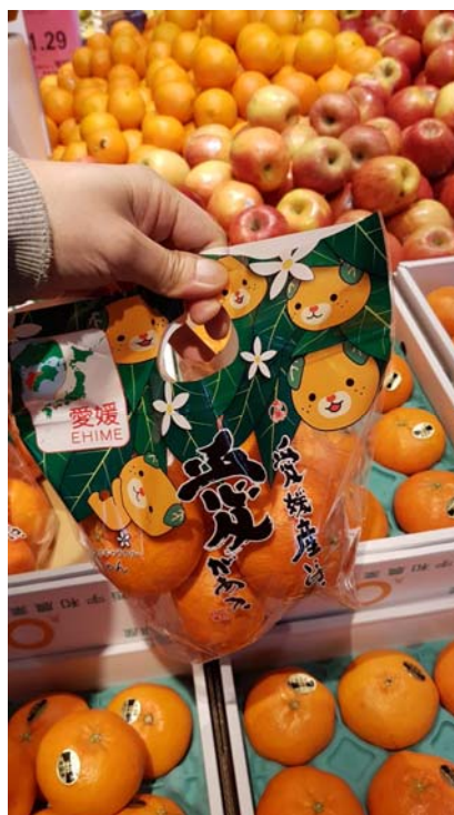
甘平店頭装飾写真

せとかについては、2月下旬に3kg箱100箱の輸出することで合意し、同時期に輸出したかんしょとともに店頭で試食宣伝会を実施した。消費者からの食味評価は好評で、量販店からの追加注文につながり、3月下旬にも3kg100箱を輸出した。