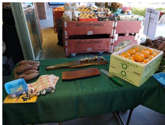
せとか店頭装飾・試食会写真