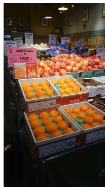
紅まどんな売り場写真

渡航中の輸入業者との商談の結果、7 月から提案を続けてきた小原紅早生については、米中貿易摩擦によるカナダ経由による迂回輸出入と港湾整備によりバンクーバー港で着港遅延が恒常化し、輸入かんきつ類の販売環境が悪化していること、また小原紅早生