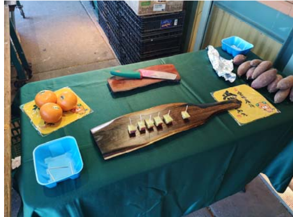
せとか試食会写真

なお、デコポン®についても継続的に提案を行ったが、カリフォルニア産 SUMO MANDARIN（品種：しらぬひ）の価格が安価である上、出回り量や食味が向上しており、量販店が SUMO MANDARIN の取扱を決定したため、商談成立には至らなかった。