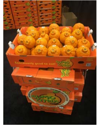
(AC FOODS(米国)のブース内 SUMO Citrus)