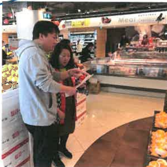
【弊社社員による販売員への説明】