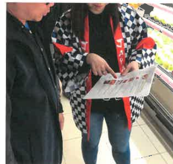
【販売員によるお客様への説明】