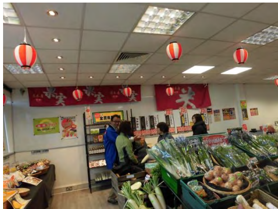
全農職員による販促。