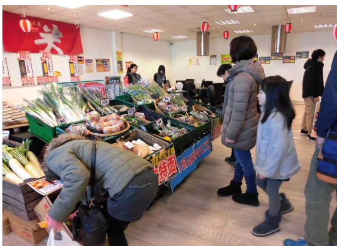
「TKトレーディングJA全農フェア」

対象国・地域 : EU(イギリス) 実施期間 : 平成28年 12月3日～12月4日 (フェアに係る出張 : 平成28年 12月2日～12月6日)