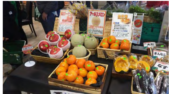
日本青果物輸出協議会作成販促資材とロンドン輸入会社作成のPOPで売り場作りした。