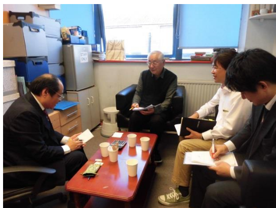
輸入会社社長と着荷状況確認。

一方、イギリスポンド安により、消費者財布のひもは固くなっており、販売スピードは遅くなっている。