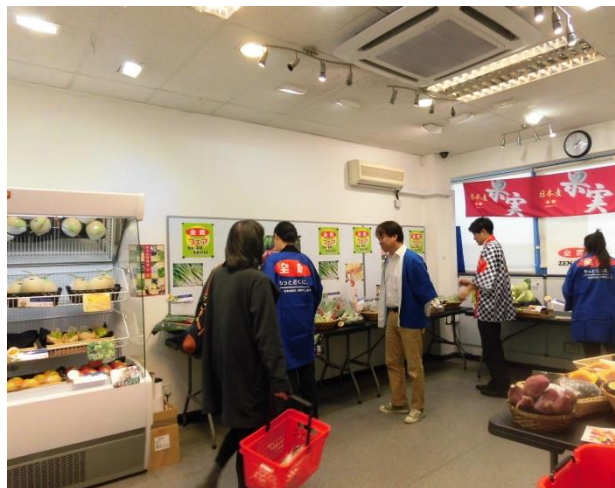
「TKトレーディングJA全農フェア」

対象国・地域 : EU(イギリス) 実施期間 : 平成29年 10月21日～10月22日 (フェアに係る出張 : 平成29年 10月20日～10月24日)